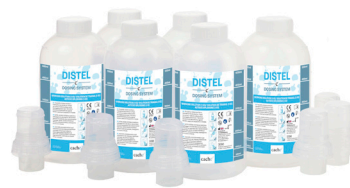
500ml DISTEL DS KIT DE DOSAGE CCH050601

1 Flacon de Concentré de 500ml - 1 tête de dosage de 5ml - 1 Étiquette pour flacon de solution de travail