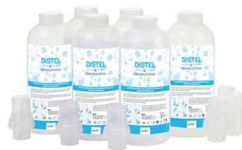
1 LITRE DISTEL DS KIT DE DOSAGE CCH050301

1 Flacon de Concentré de 1 litre - 1 tête de dosage de 5ml - 1 Étiquette pour flacon de solution de travail