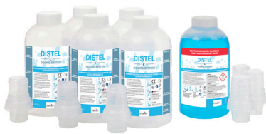
500ml DISTEL DS KIT DE DÉMARRAGE CCH050401

2000 DOSES PAR FLACON DE 1 LITRE DE SOLUTION CONCENTRÉE