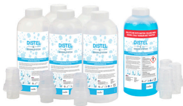
1 LITRE DISTEL DS KIT DE DÉMARRAGE CH050101

Chaque dose est identique et permet donc une désinfection uniforme pour une conformité accrue.