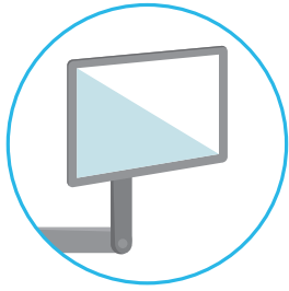
POSTE DE TRAVAIL (MONITEUR & CLAVIER)